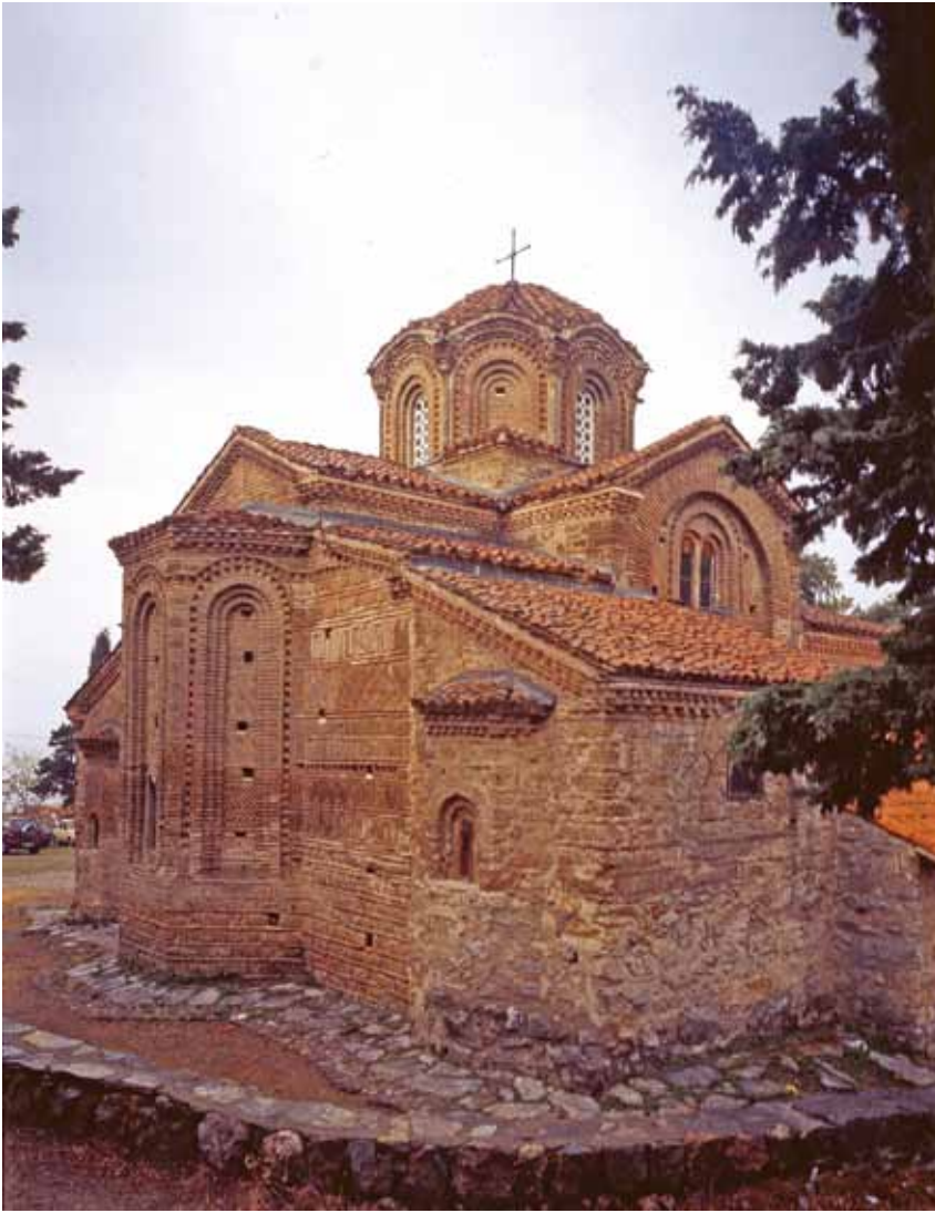
4. Црква Св. Богородица Перивлейџа, исџок

двојни и тројни запчести профилацији ја следат контурата на прозорците, а под нив, исто така, една трислојна, изведена во тула профилација која концентрично ги следи прозорците и го зголемува и продлабочува естетскиот ефект. 16