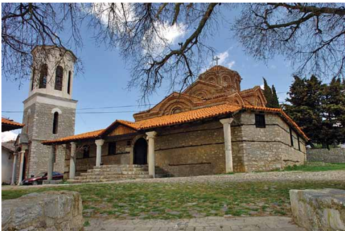
1. Црква Св. Богородица Перивлепѣа, зајад

пација, врз основа на стилот и типолошките карактеристики, со сигурност би можела да биде додадена и црквата Св. Георги во Старо Нагоричино. 5