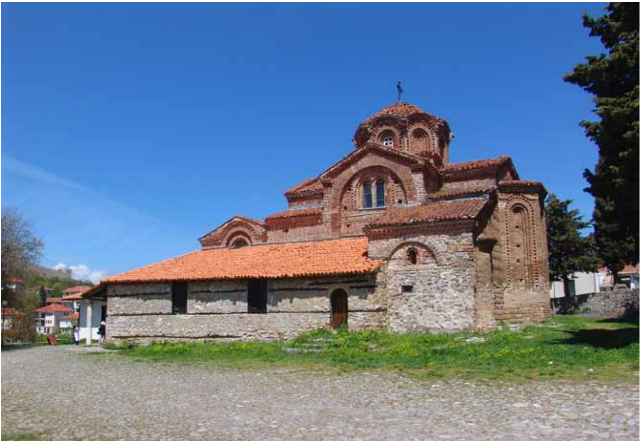
3. Црква Св. Богородица Перивлепѣта, јужоисток

крстести сводови. Димензиите на црквата се 15,5 м во должина и 9,6 метри во ширина. 13