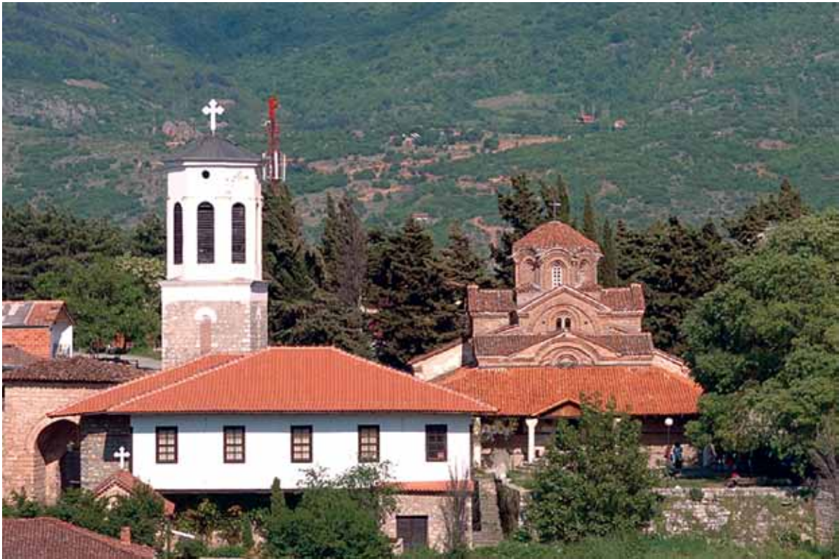
2. Црква Св. Богородица Перивлејџа, зајад

определувајќи го местото на Перивлепта во византиската архитектура, го застапува мислењето дека таа е репрезентативен пример на „грчко-византиската школа малку поинаку восприемена.“ 10